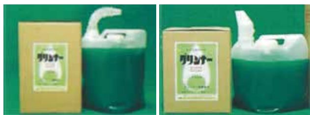
20リットル タフテナー詰