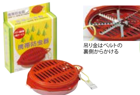
吊り金はベルトの裏側からかける