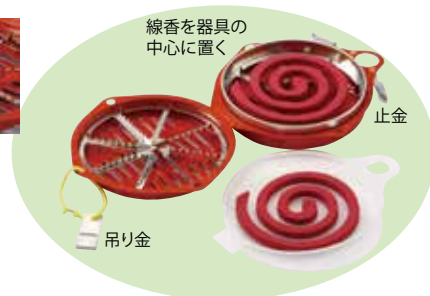
線香を器具の中心に置く