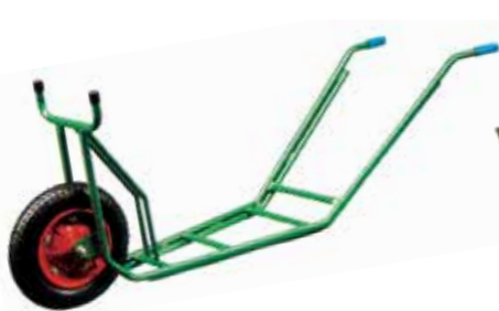
K-221 植木用低床一輪車 (ノーパンクタイヤ仕様)