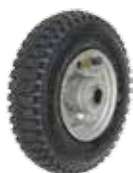
TR-2.50-4A エア入りタイヤ 4本入