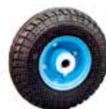
K-242 ノーパンクタイヤ 350-5