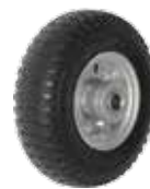
TR-2.50-4NA ノーパンクタイヤ 4本入