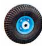
K-243 ノーパンクタイヤ 300-4