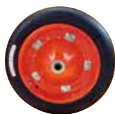
K-244 空気入りタイヤ 13×3