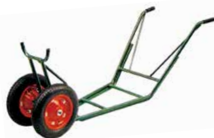
K-233 植木用低床二輪車 (ノーパンクタイヤ仕様)

タイヤの幅・ゴム厚・耐荷重が倍増。 軟弱地、砂地上走行での沈み込み防止。 左右のフラツキを抑え、安定性が抜群。 タイヤへこみが少なく、パンクや空気漏れも激減