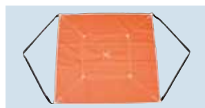
U-102B エイコーモッコタスキB マスク型 表