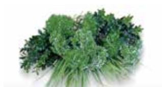
ビスタフォリア®カラーボックス ホワイトセット