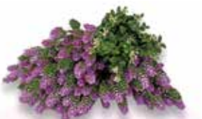
ビスタフォリア®カラーボックス ピンクセット