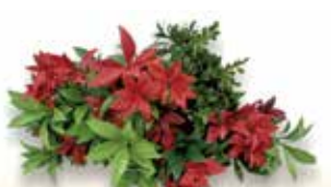
ビスタフォリア®カラーボックス レッドセット