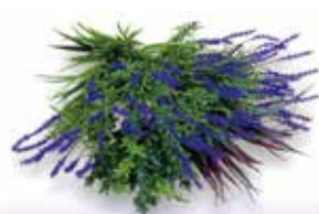
ビスタフォリア®カラーボックス ラベンダーセット