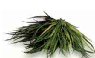
ビスタフォリア®カラーボックス グラッシーズセット