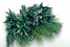
ビスタフォリア®カラーボックス ラッシュグリーンセット